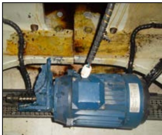
Løsrivet krøjemotor på grund af revnet krøjegear.

Mølle stoppet og gear efterfølgende udskiftet under garanti.