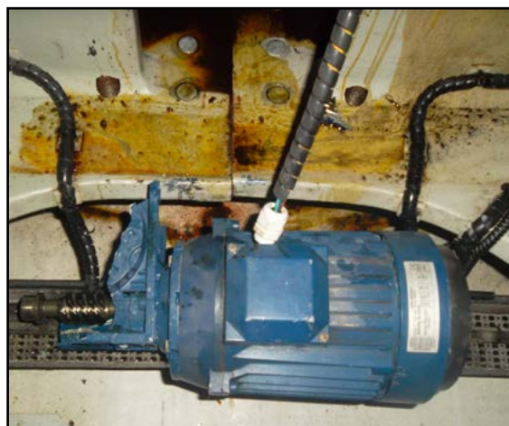
Løsrivet krøjemotor på grund af revnet krøjegear.

Mølle stoppet og gear efterfølgende udskiftet under garanti.