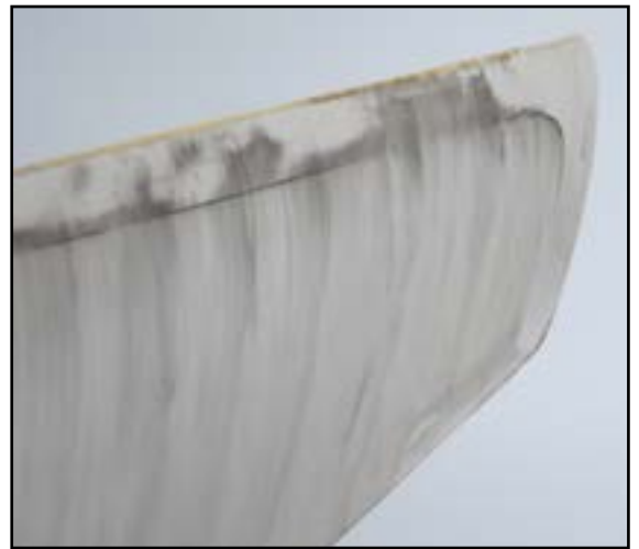
Afskalning på forkant af vinge. Behov for reparation i nærmeste fremtid hvis skadens omfang skal begrænses.