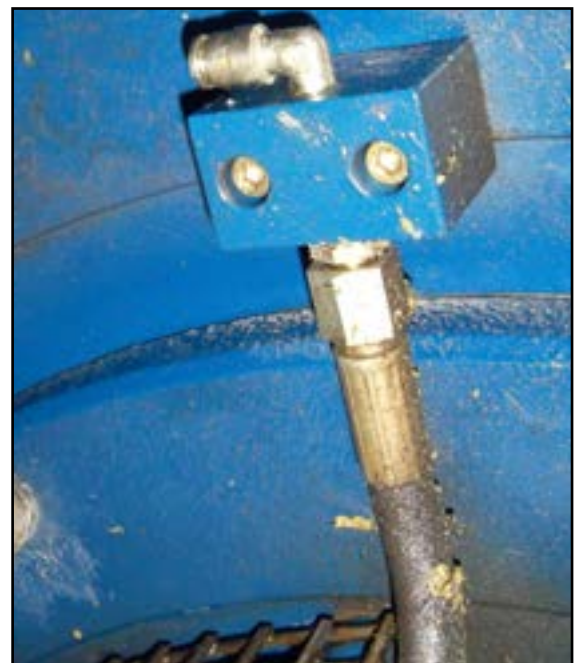
Slange til automatisk smøring af generatorleje er gået løs på generator.